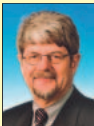
Ernst Schwanhold Minister of Economic Affairs, Energy and Transport Nordrhein-Westfalen Germany