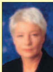
Gabriele Behler Minister of Schools, Science and Research Nordrhein-Westfalen Germany

In future, fuel cell technology will contribute decisively to the supply of energy not only in the stationary field, but also in the mobile and portable applications. However, up to that point extensive research and development work still has to be performed. This is not only applicable to the core component, the stack, but also to the system components and the generation of the hydrogen needed.